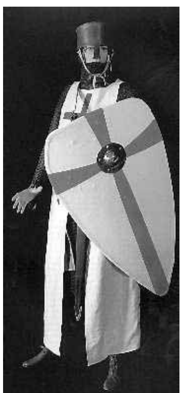
Tempelier, uitrusting uit 1150.

Ketters Hij heeft een vermoeden waarom. Nadat de Tempelorde in 1312 is opgeheven, zijn de sporen grondig uitgewist. Zo ging dat met ketters. Gevolg: een gebrek aan bronnen. De orde staat nog altijd in een kwaad daglicht, te meer omdat sommige lieden de Tempeliers misbruiken voor hun extreme hersenkronkels. Met als dieptepunt de moordpartij in de zomer in Noorwegen. Voorop staat dat Roefstra hiermee niets te maken heeft.