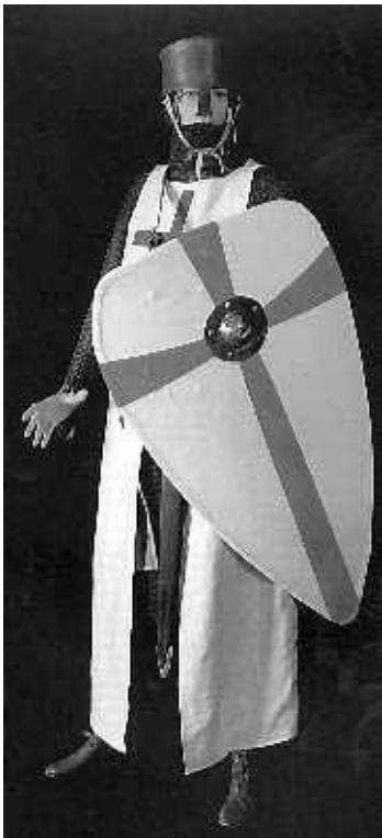
Tempelier, uitrusting uit 1150.

Ketters Hij heeft een vermoeden waarom. Nadat de Tempelorde in 1312 is opgeheven, zijn de sporen grondig uitgewist. Zo ging dat met ketters. Gevolg: een gebrek aan bronnen. De orde staat nog altijd in een kwaad daglicht, te meer omdat sommige lieden de Tempeliers misbruiken voor hun extreme hersenkronkels. Met als dieptepunt de moordpartij in de zomer in Noorwegen. Voorop staat dat Roefstra hiermee niets te maken heeft.